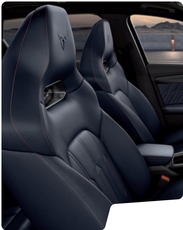
↑ FOTELE KUBEŁKOWE Z PERFOROWANEJ SKÓRY NATURALNEJ NAPPA W KOLORZE PETROL BLUE I SKÓRY EKOLOGICZNEJ 1 F VZ