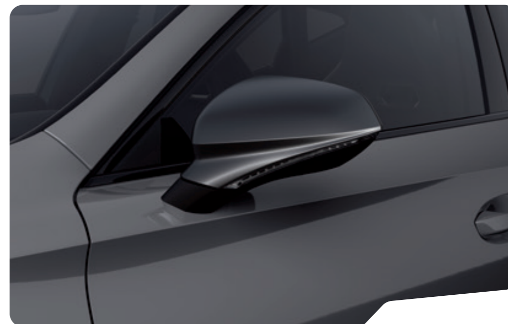
↓ GRAPHENE GREY 1 F VZ