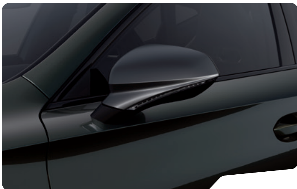
↓ DARK CAMOUFLAGE 1 F VZ